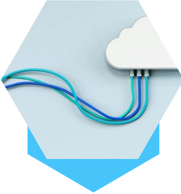
نظام الإدارة المتكاملة

إن أسيست بلس للاستشارات الإدارية شركة استشارية خاصة تقدم خدماتها الاستشارية للمؤسسات العامة والخاصة وذلك بالاستناد إلى مجموعة من المعايير الوطنية والدولية التي سبق لها تطويرها واختبارها وتنفيذها في العديد من القطاعات المعقدة والمتنوعة لمعالجة التهديدات الإقليمية والعالمية، بما في ذلك جائحة كوفيد-19 الأخيرة. تشمل خدماتنا الاستشارية كلاً من وضع خطط استجابة على مستوى المؤسسة، وخطط معالجة تعطل الأعمال، وخطط الاستجابة لحالات الطوارئ، وخطط استمرارية الأعمال، وبرامج التدريب الشاملة، بالإضافة إلى التدريبات الجزئية والكاملة لتقييم مستوى فعالية تلك الخطط.