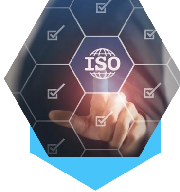
معايير نظام الإدارة - الأيزو